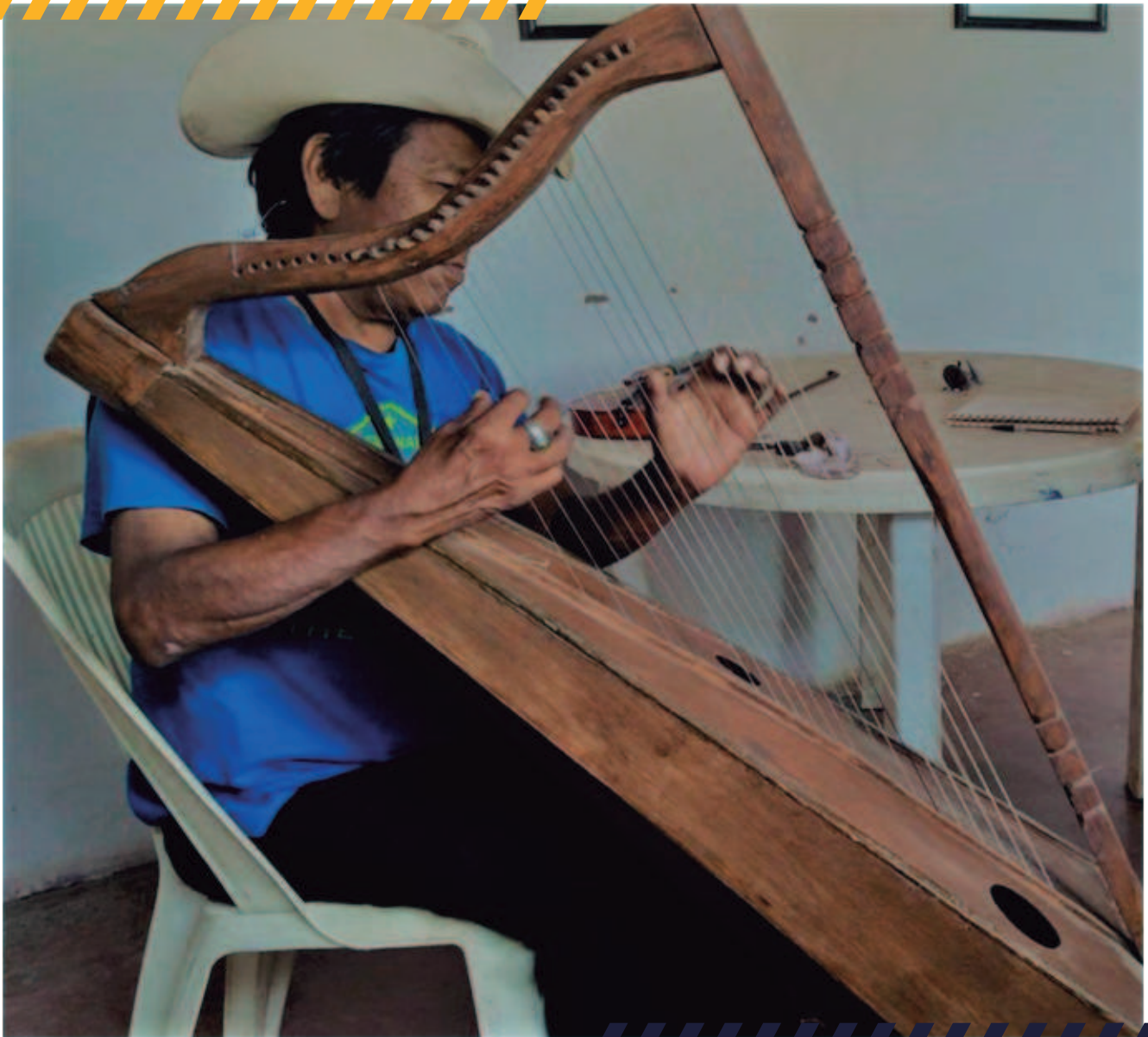
Fuente: Fotografía de Cristian S. Islas Miranda, 2016. Origen: Centro Cultural Capitán Juan María Santeamea de Pótam.