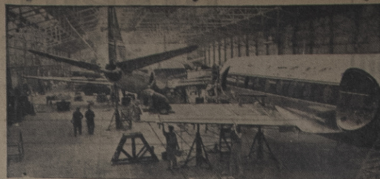
Montaje de aviones británicos de pasajeros Cickers "Viscount", en el aeropuerto de Hurn, Hampshire, de la Vickers-Armstrong Limited. El número de estas naves vendidas hasta la fecha es de 143, por valor de 41 millones de libras esterlinas. Hay opciones registradas por 24 aparatos más.

"Yo le canto a mi tierra y a (sus mujeres, yo le canto al paisaje y a sus (bellezas, yo le canto a mi gente y a sus (tristezas yo le canto a mi amada y a (sus quereres". —Entonces todas sus canciones son de tipo... ranchero... ¿No es así? —No precisamente. Son mexicanas. Quiero que lo sean.